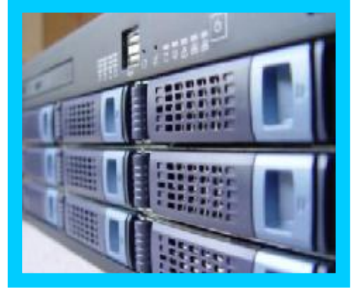
Tablo 1: Üniversitemizin Altyapı Olanakları